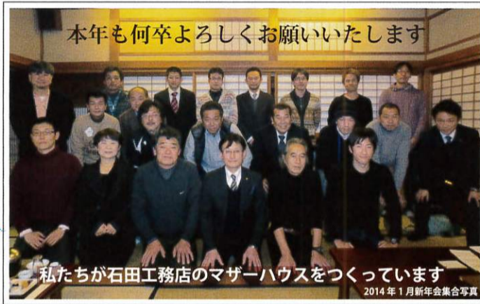
本年も何卒よろしくお願いたします