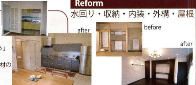
施工事例 (Y 邸)

家族の暮らしの変化にともない移転も考えたけれど「やっぱりここで暮らしていこう」古い内装を全て取り壊し床は無垢の杉板、壁には自然素材の塗料を塗りました。ベランダへ続く広がりも工夫し見事に開放的な空間へと変貌しました。