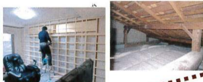
施工事例 (I 邸) 断熱改修

住宅の性能をリフォームでグレードアップ。住み心地が格段に良くなるうえに省エネや安全性も向上。