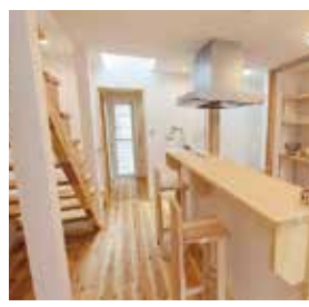
今年もキレイな家で楽しく暮らす...そんな理想の生活が手に入る...と聞かないですかね。

「私も長い間、仕事と家事、育児に介護と時間をやりくりしながら家をキレイに保ちたいと暮らしてきました。私に限らず多くの方々もそうでしょう。そんな時におススメしたいのは「毎日必ずやるちょっとした片付けと小掃除」です。家族全員で寝る前の15分間の回りや気付いた所をキレイにして就寝するという習慣です。