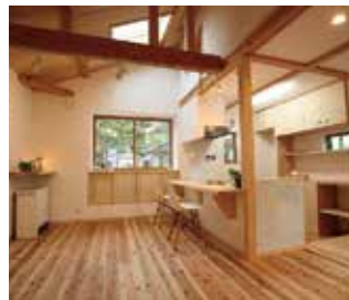
するポイントをご紹介します。と思います。

それは、片付けとお掃除、この2つではないかと思えます。常に「掃除しやすい家」にしてあげれば、日々の掃除は手軽になり、キレイを保つことができます。まずは、掃除しやすい家にするポイントをご紹介します。