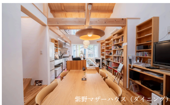
紫野マザーハウス (ダイニング)

上質な空気は病気のリスク減少、睡眠の質の向上などが期待できます。その他にも、生活臭の除去やカビの発生予防など、空気の力が快適性に及ぼす影響は計り知れません。高気密・高断熱な石田工務店の住宅は空気がきれいにいきかえ、室内を汚染から守ります。