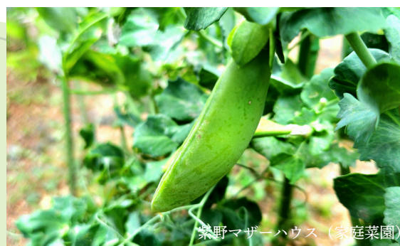
紫野マザーハウス (家庭菜園)

無垢床の特徴は、まさに自然素材ならではの温もりと色あせない美しさです。素足で歩いた時の心地よさは格別。冬暖かく、夏涼しく、一年を通して快適な空間を生み出します。唯一無二の木目とその経年変化は家に個性を与え、環境への配慮も両立させます。