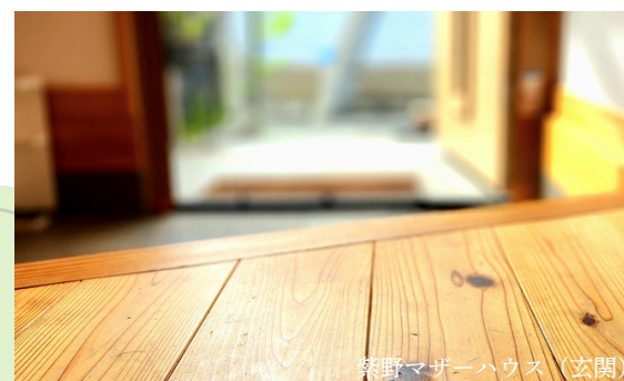
紫野マザーハウス (玄関)