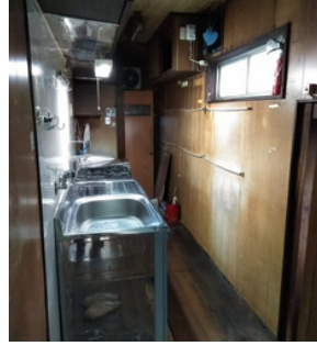
工事前のキッチン

キッチンの向きを180° 変え、壁を撤去したことで解放感が出ました。木製カウンター内部には家電が収納できます。